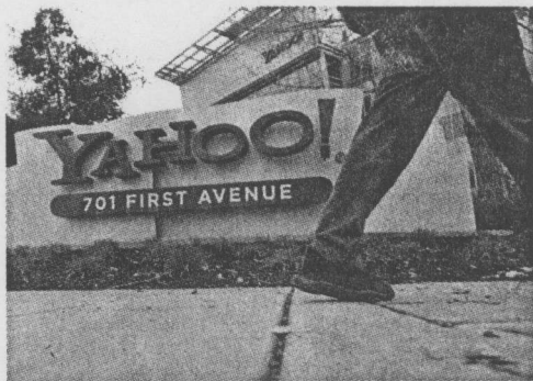
▲H1B 申請越來越嚴格，許多國際人才黯然離開。