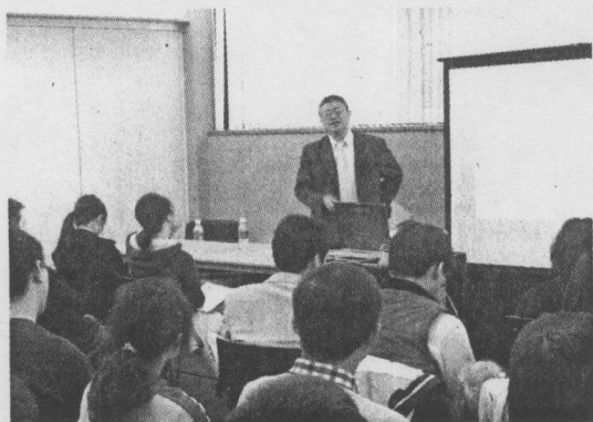
■李亞倫律師在羅格斯大學演講。