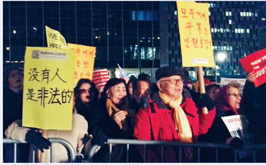
■ 特朗普總統的移民行政令，引起各地示威抗議。

本報記者榮筱紐約報導 特朗普總統的移民行政令雖然引起滿城風雨，但至今為止引發的實際效果似乎只有 ICE 對國內無身分移民的抓捕。但美國移民協會的移民問題專家近日在該會網站上撰文指出，其實國安部已經在上個月悄悄修改了政治庇護官培訓課程，新的培訓將可能導致申請政治庇護更加困難，而那些千辛萬苦來到美國申請政庇的人更可能剛一入境就被遣返。